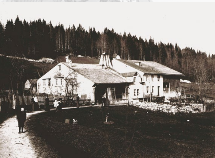
Tivoli, près du Solliat, où des milliers de Bourbakis arrivés sur la commune du Chenit furent désarmés.

Cette exposition vous est offerte par le Patrimoine de la Vallée de Joux.