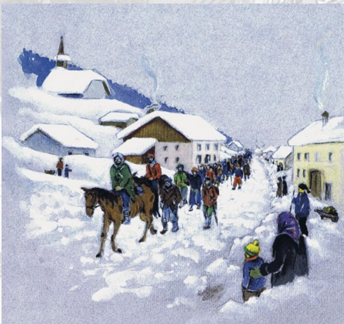
Les réfugiés Bourbakis passent aux Bioux. Dessin Michel Freymond

TOUS LES JOURS DU DIMANCHE 7 FÉVRIER AU DIMANCHE 7 MARS 2021, SAUF LE LUNDI.