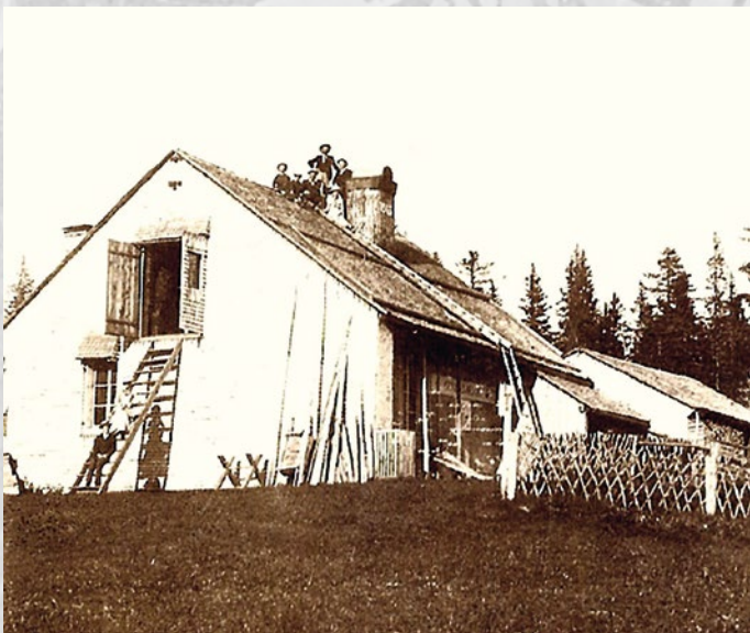
Ils furent nombreux, venus de Chaux-Neuve et après avoir franchi la frontière, à passer tant devant le Chalet Capt que le Poste des Mines.